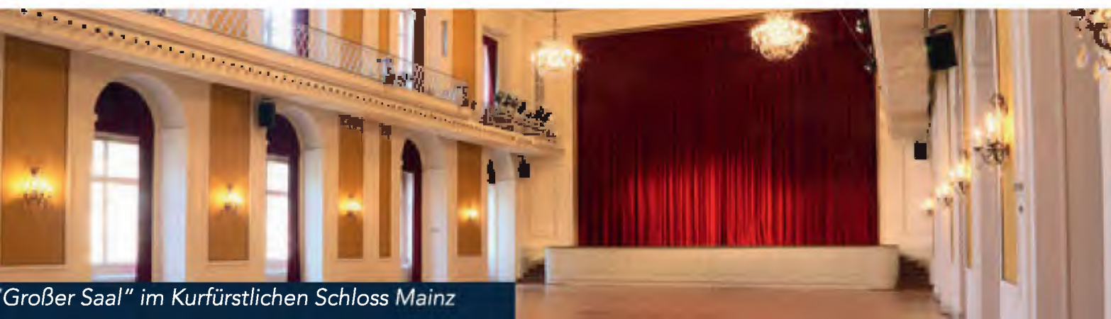
Großer Saal“ im Kurfürstlichen Schloss Mainz